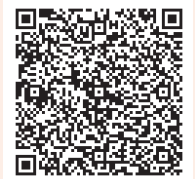
堺市電子申請 システム

堺市電子申請システムまたはお電話で健康推進課か口腔保健センターまで予約をお願いします。